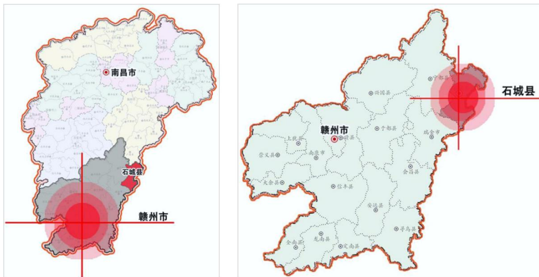
图 2-1 石城县交通区位图